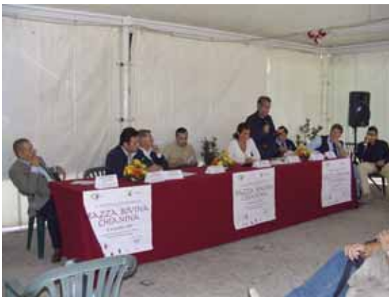
Un momento del meeting

La penultima, a cura del prof. Arcangelo Gentile della Facoltà di Veterinaria dell'Università degli Studi di Bolo-