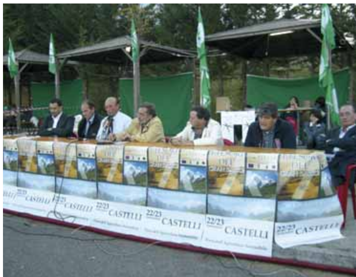
Le autorità intervenute

Il programma della domenica apriva i battenti alla prima asta di giovani femmine di razza marchigiana, provenienti da pascoli montani, che praticano abitualmente l'alpeggio. Ben 13 sono state le manze presentate, provenienti da 7 allevamenti della zona. In apertura d'a-