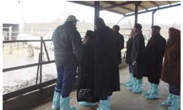
La delegazione Sud Africana durante la visita agli allevamenti