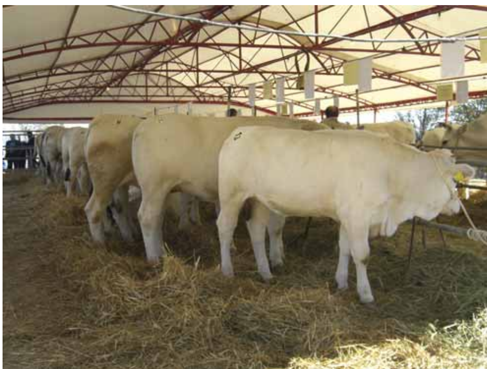
Le manze presentate in asta