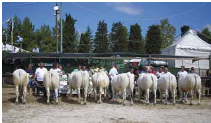
Una parte degli animali in mostra

A queste due aziende se ne stanno, però, aggiungendo altre. Questa razza, infatti, sta riscuotendo sempre più l'interesse degli allevatori locali, soprattutto delle aree montane, grazie alla sua particolare rusticità ed adattabilità ad ambienti ostili. Non bisogna dimenticare, inoltre, la qualità della sua carne, del suo latte e l'elevato valore della lana, dotata di pregiata