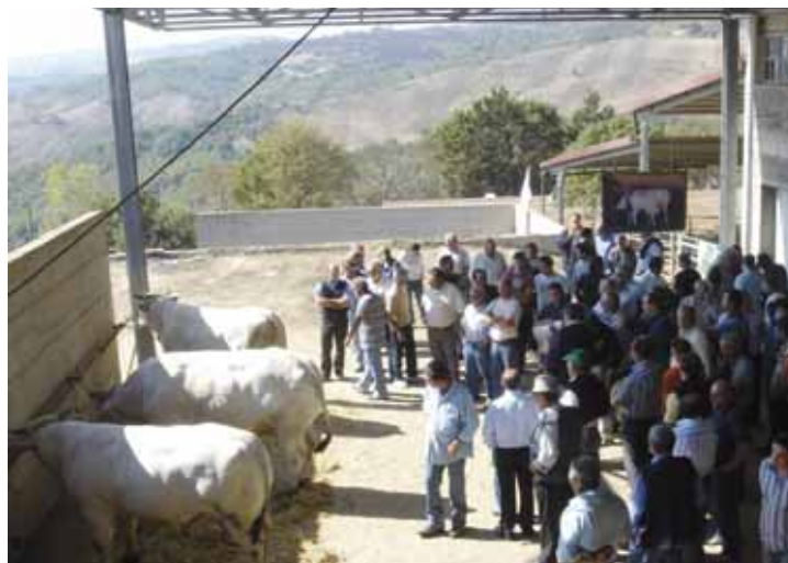
Una fase delle valutazioni

Dopo la parte pratica sul bestiame gli intervenuti si sono spostati in una vicina tensostruttura adattata a