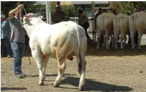
Uno dei capi in mostra