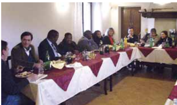
Il pranzo presso l'Azienda Luchetti

tenente alle razze Romagnola e Chianina è presente in Sud Africa già da oltre un decennio e che sono in corso da tempo contatti tra gli allevatori sudafricani delle due razze e l'ANABIC. La visita fa seguito, infatti, alle relazioni avviate tra l'ANABIC e la Repubblica Sudafricana a partire dal mese di Marzo 1995, anno in cui fu effettuata la prima esportazione di capi di razza Romagnola nel Paese. Negli anni seguenti l'ANABIC si è più volte recata in Sud Africa, dove è stata ricevuta e guidata in visita agli allevamenti locali dal Club degli allevatori della Romagnola Sudafricana, che ha tra i suoi più attivi promotori il dr. Armando Balocco. Oltre al buon livello dei capi presenti, è stata riscontrata una grande fiducia nelle potenzialità della razza, apprezzata in virtù della capacità di accrescimento confermata da prove di performance eseguite in loco, della vitalità dei vitelli alla nascita, della velocità di crescita dei prodotti di incrocio con le razze indigene, dello sviluppo muscolare, della docilità unita ad un forte istinto di protezione del vitello. Il forte interesse degli allevatori sudafricani si è manifestato anche in occasione del Congresso mondiale delle razze italiane da carne, svoltosi a Gubbio nel mese di Maggio 2005, in occasione del quale la delegazione su-