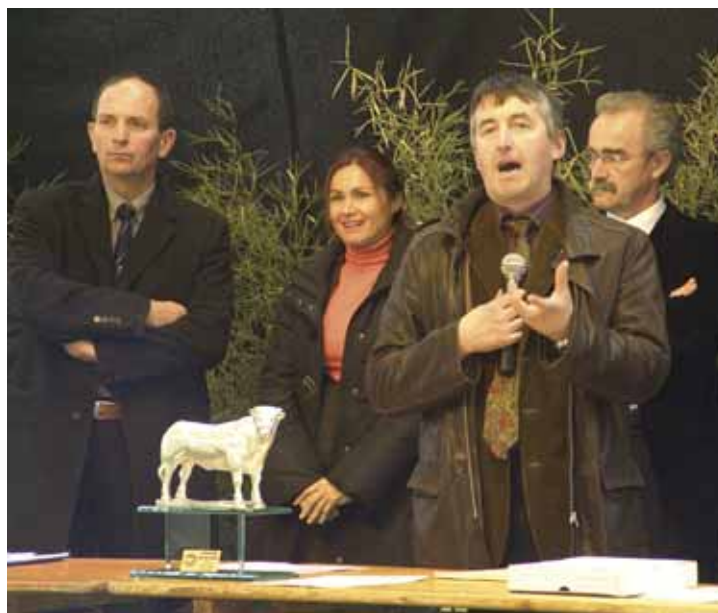
Un momento delle premiazioni