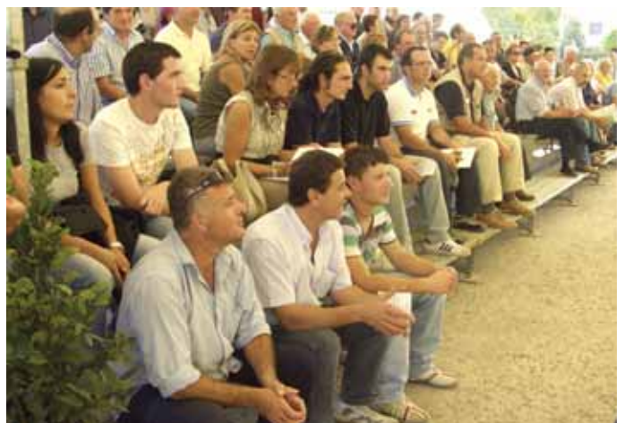
Gli esperti ascoltano con attenzione

La tappa successiva del tour di aggiornamento riservato agli esperti è coincisa con il 1° Meeting Nazionale della razza Chianina , svolto a Ponte a Tresa il 15 settembre scorso. All'evento, perfettamente riuscito, dal titolo " La Chianina patrimonio di tutti ", sono convenuti, oltre agli esperti, allevatori della razza provenienti da numerose Regioni anche lontane dalla culla di origine, i quali hanno trovato in questa sede, un qualificato momento di incontro con i tecnici del settore.