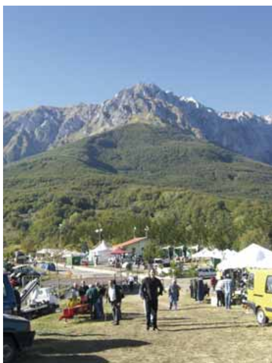
Lo splendido panorama offerto dal Monte Camicia

S otto lo sguardo mozzafiato del gruppo montuoso del Gran Sasso, alle pendici del Monte Camicia, gli allevatori teramani si sono dati appuntamento il 22 e 23 Settembre scorso presso il Comune di Castelli, Loc. Befaro, per una manifestazione zootecnica che ha visto quale indiscussa protagonista la razza Marchigiana. La "Fiera dell'Agricoltura Sostenibile" organizzata dall'ARA Abruzzo – Sezione di Teramo, presente con lo staff al completo, si è aperta con la degustazione di carne Marchigiana certificata IGP "Vitel-