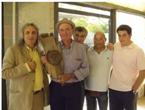
La consegna del Premio "Guidino"