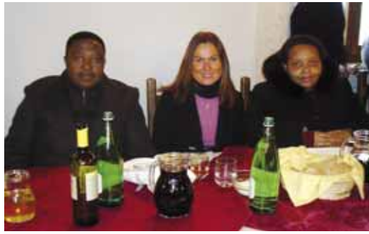
Il Direttore Anabic con la Delegazione Sud Africana