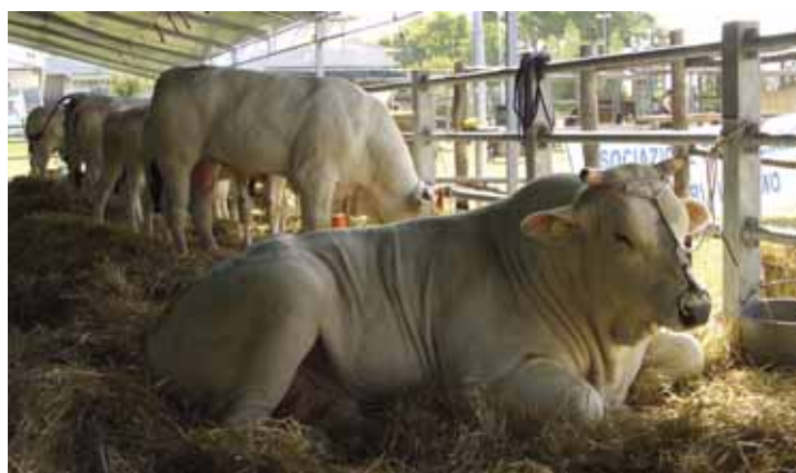
Alcune immagini delle pensiline