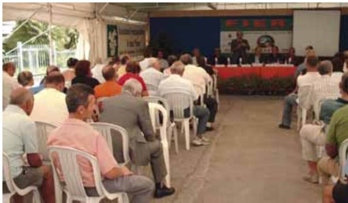
Un momento del convegno