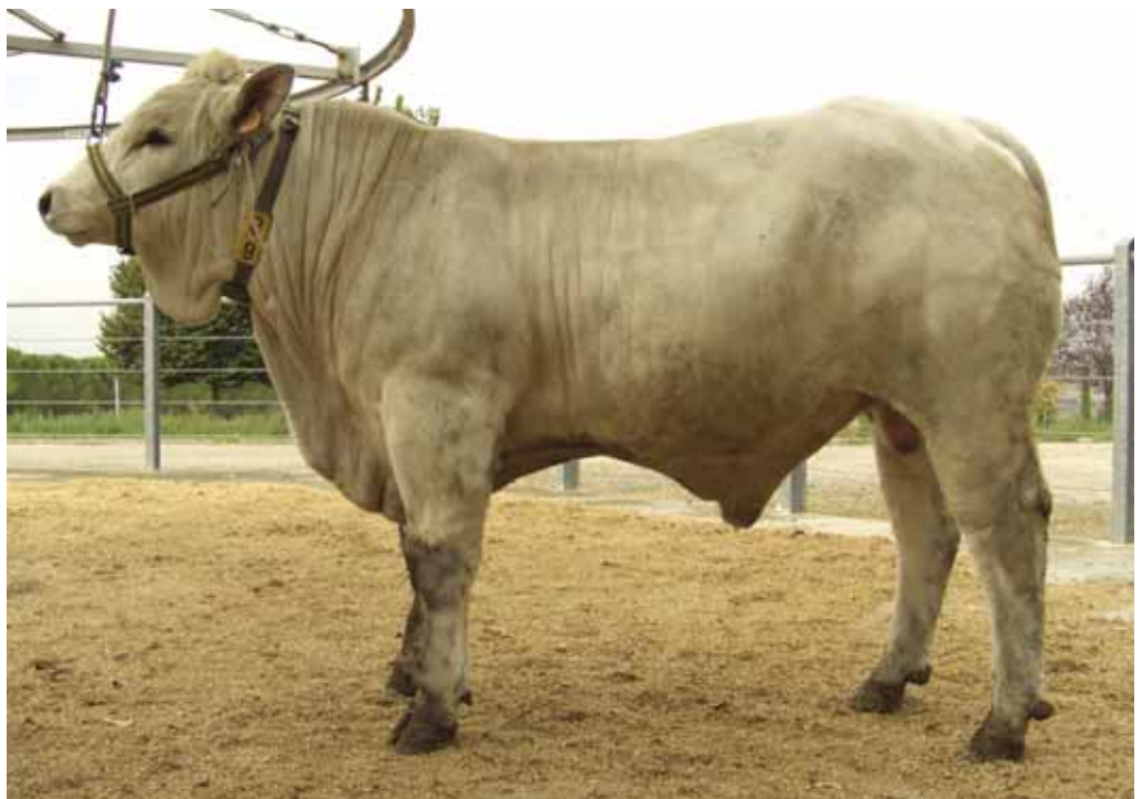
Settebello della Radice, uno dei tori in asta per la razza Romagnola